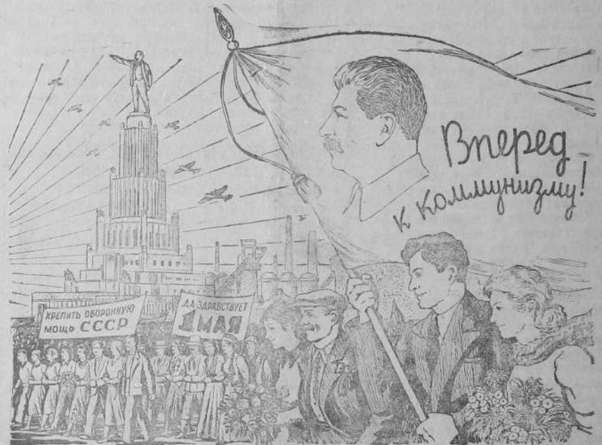
Рисунок Б. Уханова