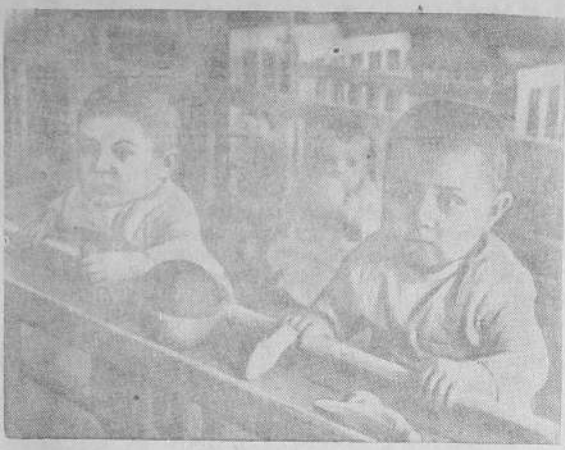
САМЫЕ МОЛОДЫЕ ГРАЖДАНЕ СТРАНЫ СОВЕТОВ

Воспитанники детского сада № 2 вместе с главным заводом радостно встречают Первомайский праздник. Сегодня в детском саду состоится утренник, который проводится силами самих ребят.